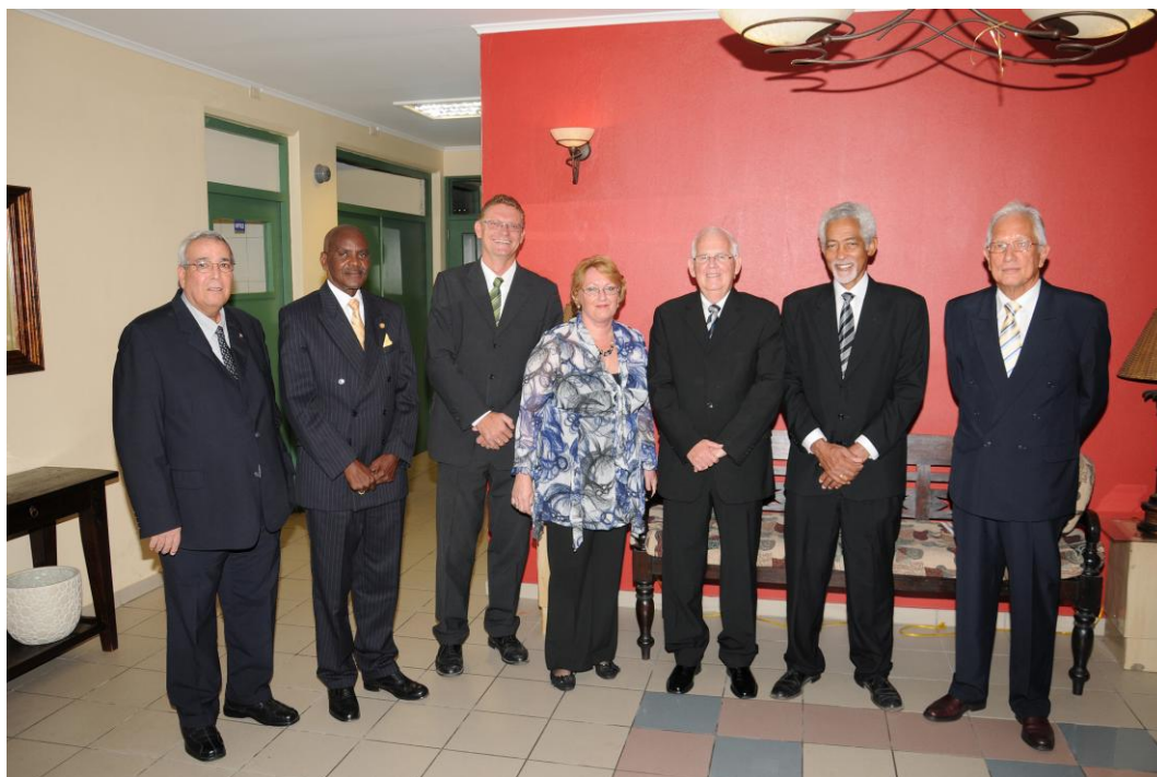
De Raad van Advies Aruba tijdens zijn receptie op 13 mei 2011 ter viering van zijn 25-jarig jubileum.